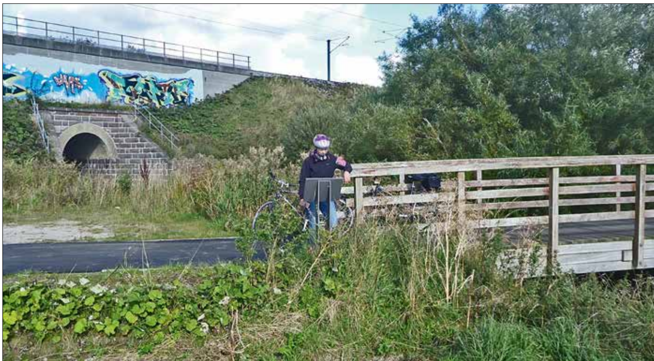
Den nye informationstavle ved Snydebro studeres på en tur ad supercykelsti 97.