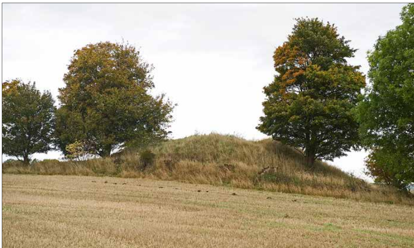
Stenalderhøjen Baunehøj i Smørum.

I forbindelse med projektet ”Danmarks oldtid i landskabet” lod Kulturstyrelsen i samarbejde med Kroppedal Museum og Egedal Kommune i 2014 opføre et Panop-