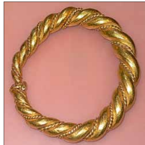
Guldarmring fra år 900 e. Kr.

Betegnelsen wendelhalsring skyldes dens karakteristiske snøninger. Bronzehalsringen blev fundet under forårssåningen i 1952 på Schæfergårdens marker ved en overpløjet gravhøj, hvis grundplan blev nærmere undersøgt af Kroppedal Museum i 2004. Højen er fra yngre stenalder, men er blevet ændret og udvidet mod nord for at give plads til yderligere en begravelse i bronzealderen. Grav 1 er den oprindelige stensatte grav fra yngre stenalder, grav 2 er fra udvidelsen i bronzealderen. Grav 3 blev i stenalderen anlagt som en jordfæstegrav nordvest for den oprindelige høj. Den indeholdt et forholdsvis velbevaret skelet af en ung mand på ca. 20 år.