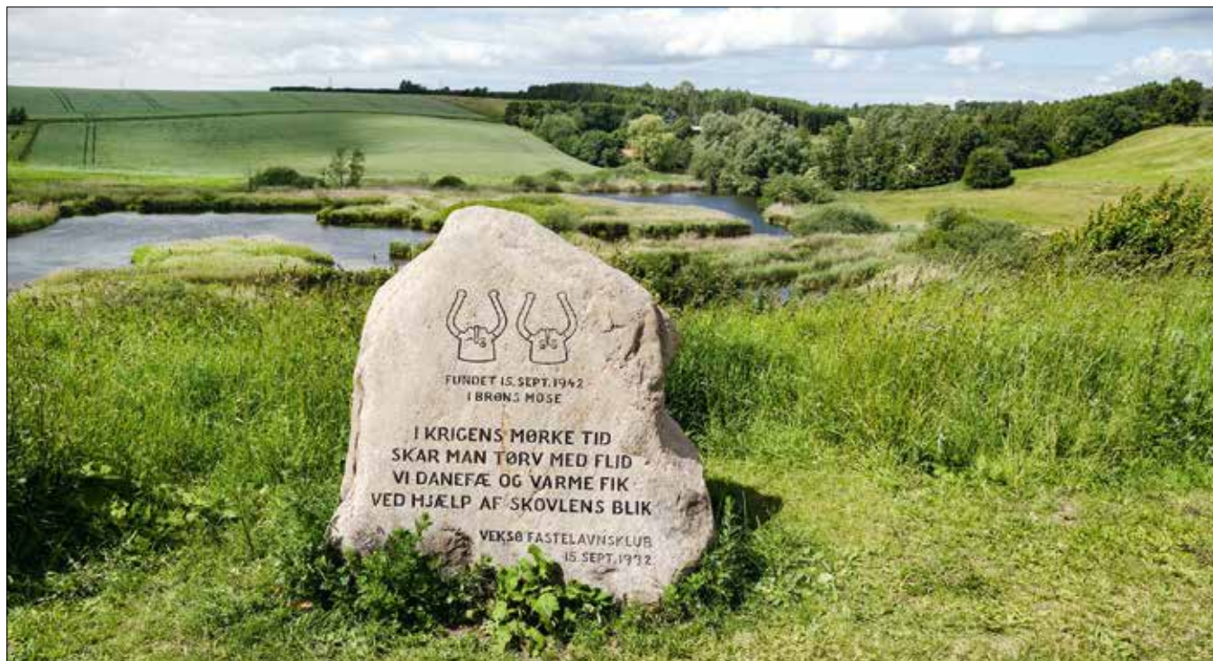
Mindesten for fundet af Viksøhjemlene.