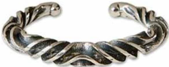
Armring med den karakteristiske wendelsnøning. Kopismykke fra Nationalmuseet.

Fundet, også kaldet Maglehøjdepotet, består af ti slebne tyndnakkede flintøkser. De er fundet nær Sørup Rende nord for Smørumovre i år 2001-2. Drænrørene på det lavtliggende område skulle repareres, og i den forbindelse dukkede de første seks økser op. Ved en fotografering på det historiske sted i foråret 2002 opdagede man pludselig økse nr. syv. Dette gav anledning til en eftergravning om efteråret, som gav yderligere to økser. Da man til sidst endevendte den opgravede jord, dukkede økse nr. 10 op. Økserne er aldrig blevet brugt som arbejdsredskaber, men er formentlig lagt i mosen som en offergave i forbindelse med en religiøs/rituel handling. Økserne er et af Danmarks fornemste depotfund fra yngre stenalder, og fundet vises i Nationalmuseets permanente oldtidsudstilling.