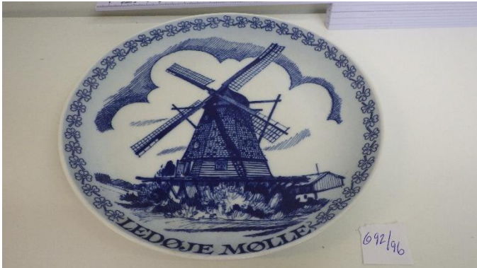
Platte Ledøje Mølle