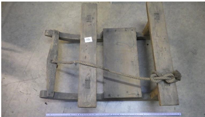
Slæde i træ