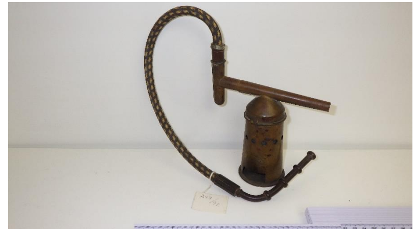
Røgpuster – biavl