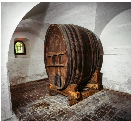
Vinfad fra 1844, Den Gamle By.